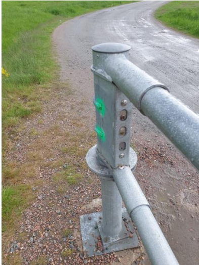
Bild på bommen in till området, det är det ÖVERSTA låset av tre som du ska öppna om du vill köra in på området (bommen är till vänster om den parkering som markerats i blått på bilden).