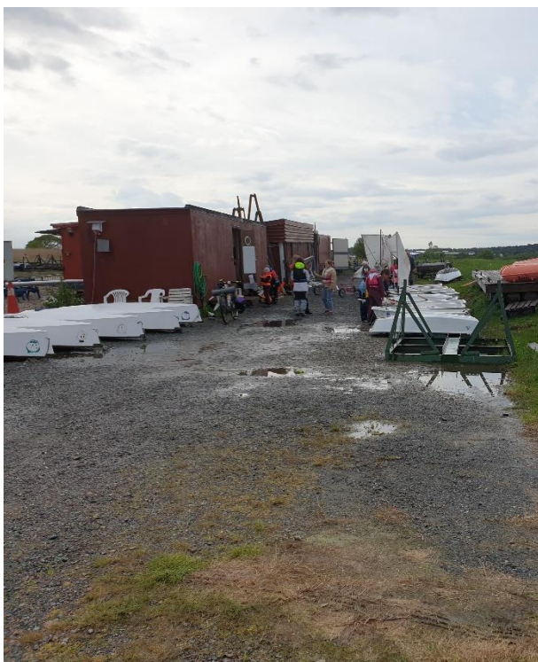
Boden till vänster med öppen dörr (närmast vattnet) innehåller paddlar, flytvästar m.m