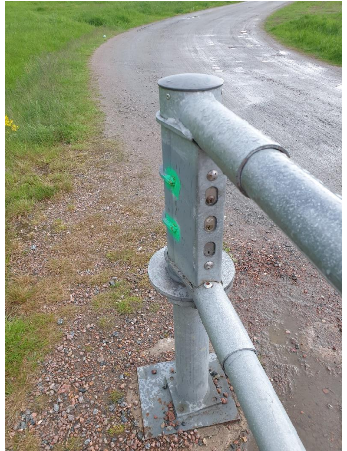
Bild på bommen in till området, det är det ÖVERSTA låset av tre som du ska öppna om du vill köra in på området (bommen är till vänster om den parkering som markerats i blått på bilden).

Du behöver bara öppna det hänslåset i mitten som binder ihop de andra låsen. De andra är bara där för att huvudlåset var för grovt för kättingen. Låsen kärvar lite men nya är på gång. Låsen kärvar lite men nya är på gång. Finns f.n. två nycklar på spiken, ett per lås.